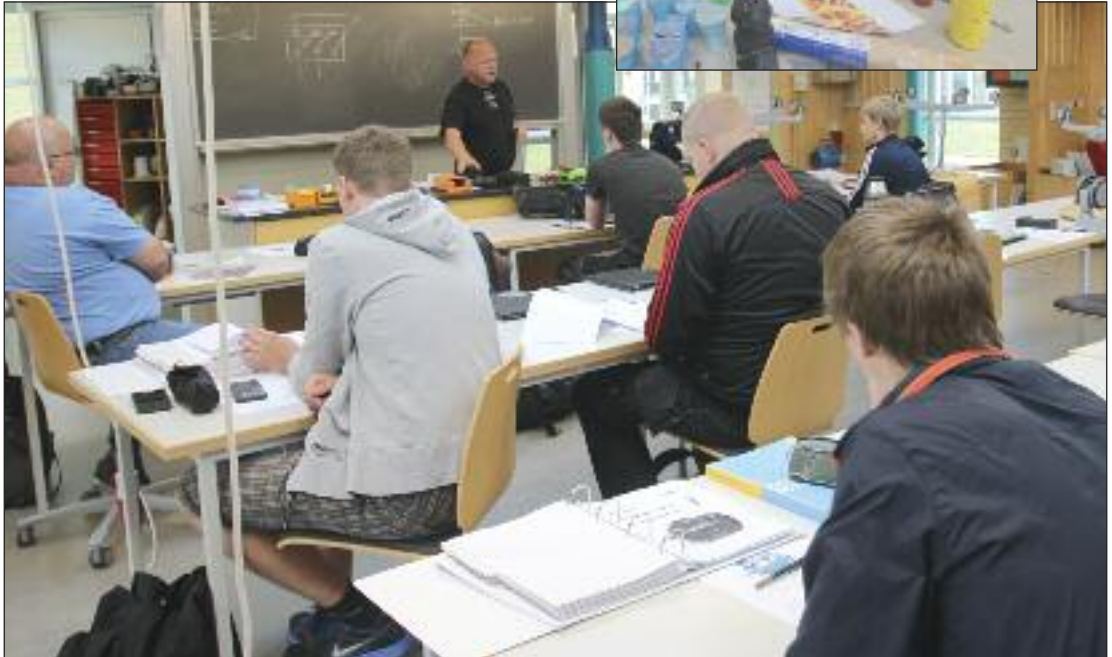
Elektrikere på uddannelse.