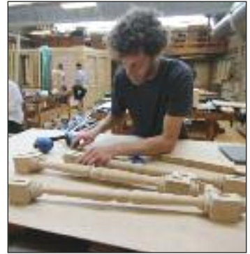
Møbelsnedkerelev i præcisionsarbejde på EUC Nord i Hjørring.

Desuden er der Autobranchens kompetencecenter, hvor importørerne af nye bilmodeller kan uddanne medarbejdere, så kunderne oplever, at der er styr på det tekniske omkring deres nye bil. Der bliver taget hånd om eleverne på EUC NORD. Også elever med ekstra behov. Der er støtte omkring afklaring, almenfaglig, personlig og social udvikling. Der er også skolehjem, hvor medarbejderne hjælper eleverne, og de unge er generelt meget motiverede, siger Søren Nielsen.