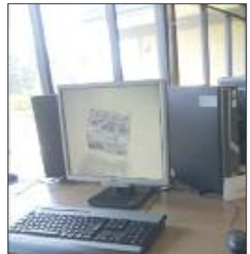
Teknik og edb hører nøje sammen. Uden uddannelse og edb er der ikke tekniske fremskridt.