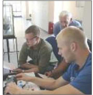
Elever løser et teknisk problem på Martec. Her, som andre steder, er der tale om gruppearbejde.

Maritime and Polytechnic College Hånbækvej 54, 9900 Frederikshavn, Danmark Tlf. +45 96 20 88 88 E-mail: martec@martec.nu